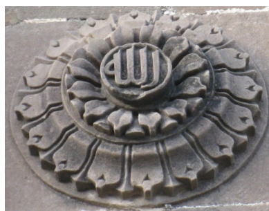
Надпись «Аллах» на камне

У. Считается: кто запомнит 99 имен Аллаха, тот войдет в рай. Для облегчения счета во время безмолвной молитвы Богу иногда используются субха – чётки. Они состоят из 99 или 33 бусин, каждая из которых соответствует одному из 99 имен Аллаха.