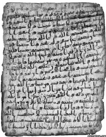
Коран. Артефакт VII в.

- При жизни Мухаммеда Коран передавался устно. Первые записи полного текста Корана были сделаны лишь после его смерти.